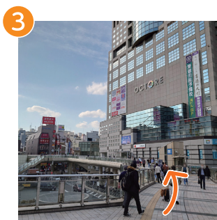
3 八王子オクトーレ前で左に曲がる