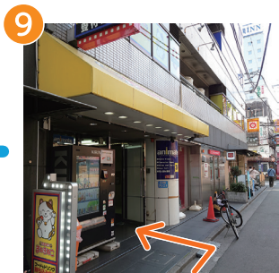
9 左手にピオスビルが見えてくる