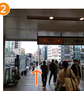
2 マルベリーブリッジに進む