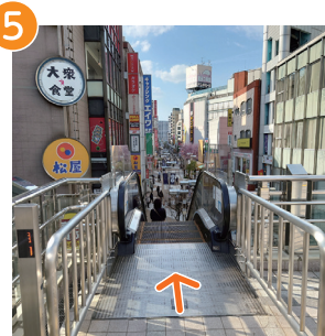
5 下りのエスカレーターに乗る