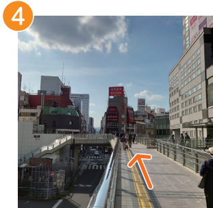
4 八王子オクトーレの前を進む