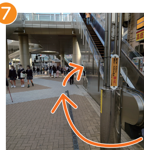
7 降りたらUターンしスクランブル交差点へ