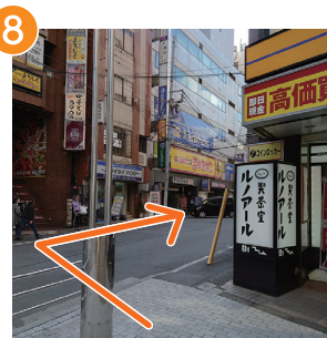
8 横断歩道を渡り、右に曲がる